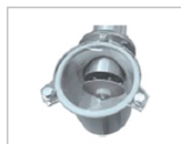
Dosing & weighing