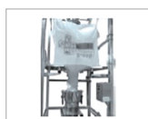
Emptying bigbags, sacks, containers