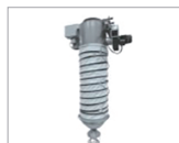
Filling trucks, waggons