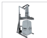
Filling bigbags, drums