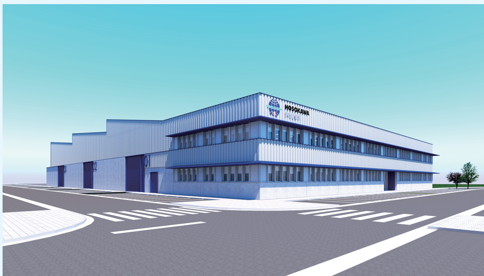
スペインに新たな生産施設 New production facilities in Spain