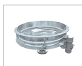
Emptying silos, hoppers